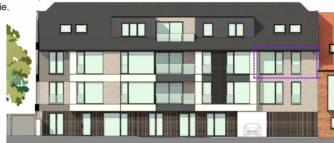
Voorgevel, schaal 1/200