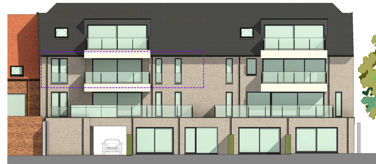
Achtergevel, schaal 1/200